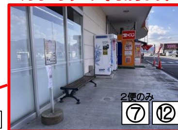
2便のみ ⑦ ⑫