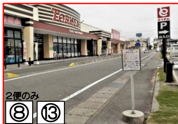
2便のみ ⑧ ⑬