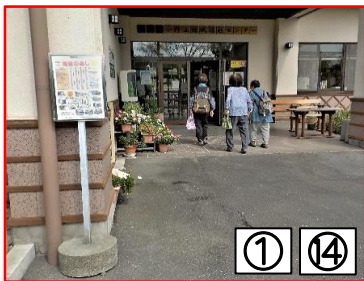
① ⑭ 小野上地域福祉センター ☆館内に日用品や食品などの売店があります。