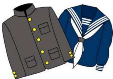
卒業や成長で不要となった制服