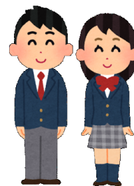
制服を必要とする家庭