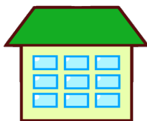
【社会福祉協議会】 保管